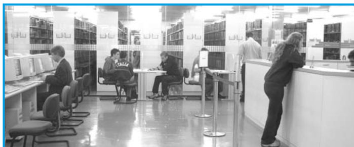
Biblioteca da FEA: rumo à biblioteca digital, sem restrição de espaço e de tempo

A INTERNET AINDA NÃO ATINGIU A MAIORIDADE, MAS JÁ REVOLUCIONOU A GESTÃO DO CONHECIMENTO E TRANSFORMOU O CONCEITO DE BIBLIOTECA. Muito além da área física tal como foi concebida, temos hoje nas chamadas bibliotecas digitais acesso a todo conhecimento humano possível, sem restrição de espaço e de tempo.